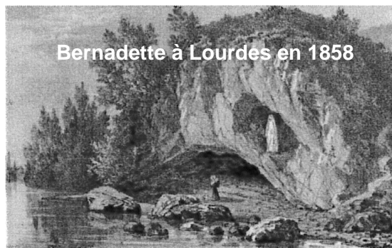
Bernadette à Lourdes en 1858

À nous de témoigner avec fidélité et justice, de la Tendresse et la Bonté du Seigneur, comme le dit si bien le Pape François : « nous ne devons pas avoir peur de la Bonté et de la Tendresse » (19 mars 2013). Avec une grande Joie, pour porter l'Évangile : « La joie de l'Évangile remplit le cœur et toute la vie de ceux qui rencontrent Jésus. Ceux qui se laissent sauver par Lui sont libérés du péché, de la tristesse, du vide intérieur, de l'isolement. Avec Jésus Christ, la joie naît et renaît toujours. – Le bien tend toujours à se communiquer. » (Pape François - Exhortation apostolique « La Joie de l'Évangile » - N° 1 et N° 9).